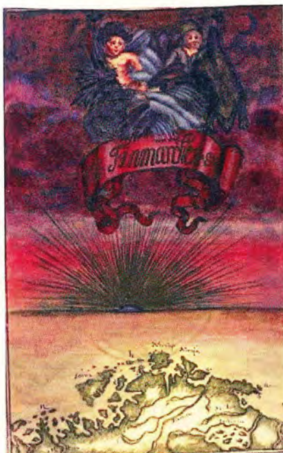
Finnmarchen av Hans Hansen Liliensjold