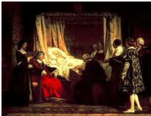
Isabel la Católica dikterer sitt testamente (1864) Eduardo Rosales

Hans råd var at massiv import av svarte (afrikanere) ville lette arbeidet til indianerne, som ikke hadde sterk nok fysikk til arbeidet spanjolene krevde. Han ble kalt for indianernes apostel. Apostelens gode intensjoner la grobunnen for slaveriet i Amerika.