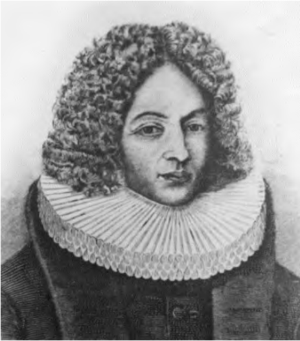
Tomas von Westen (1682-1727)

Samisk prest og diktar Anders Fjellner skreiv helteeposet Päiven Parneh /Beivvi bártnit, (Solsonen).