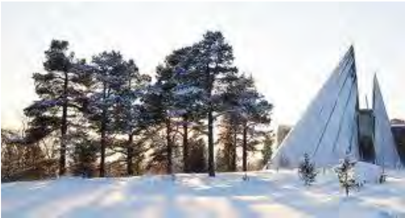
Sametinget i Kárásjohka.

Det norske språket er det ein høyrer rundt seg og høver seg til. Dei norske reglane er dei gjeldande.