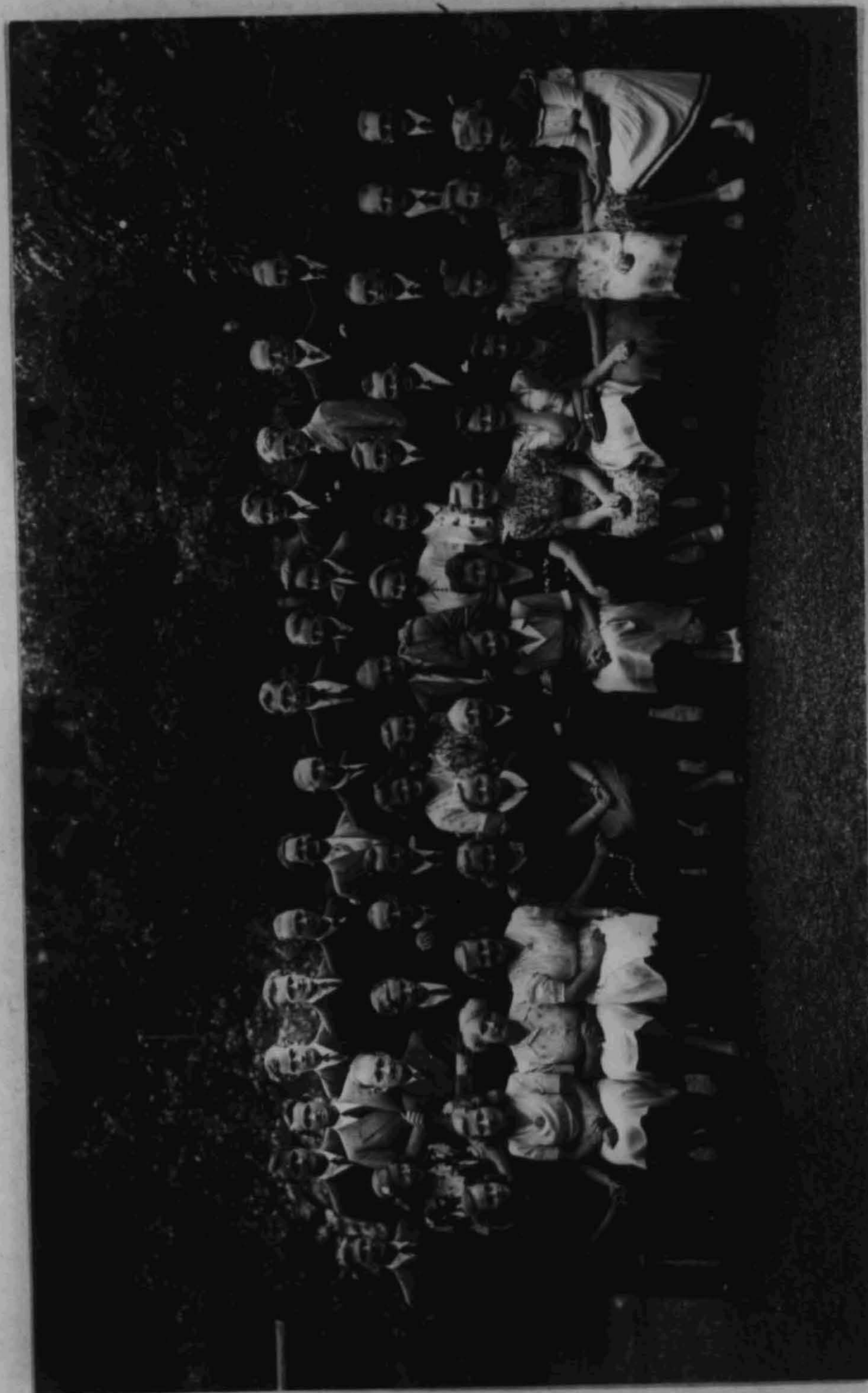
Vi må også hjelpe dem som trenger hjelp enn kjægen. for å komme i gang med sitt arbeide, Freden var tross alt målet.