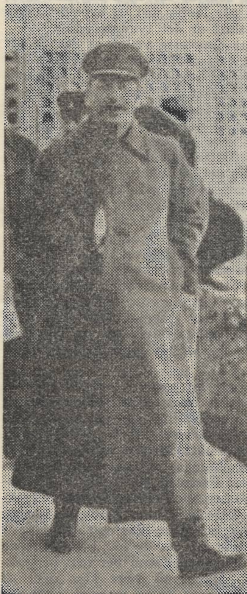
MØTET I KREML.

Likesom de russiske stepper og Ukrainas blodbestenkte jorder er blitt krigens sentrale og avgjørende skueplass, er Kreml blitt det politiske og diplomatiske sentrum. Som Sovjets øverste krigs- og