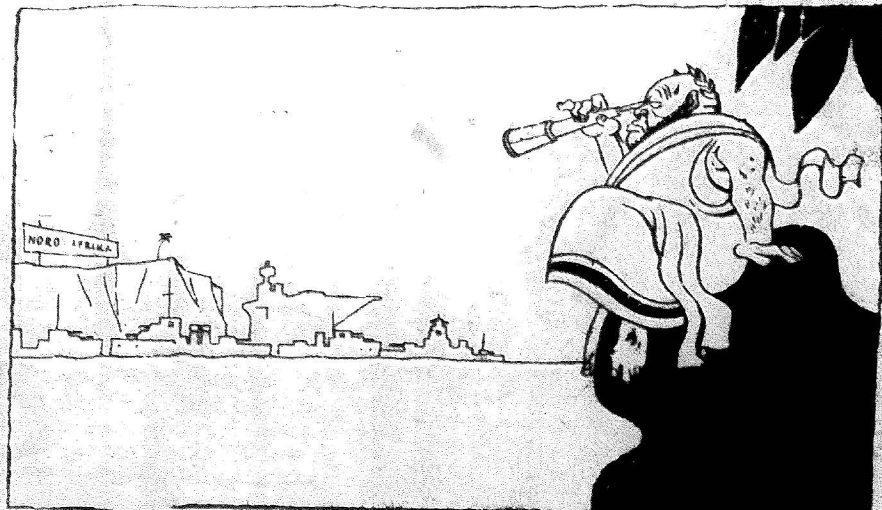
Tegnet for Norsk Tidning av Stephen

Det er ennå lesere som beholder avisen for lenge. Send den videre til en pålitelig nordmann straks du har lest den. Det er tusener som venter. La ikke avisen gå ut av sirkulasjonen for papiret er utslitt. Husk at den aldri blir for gammel.