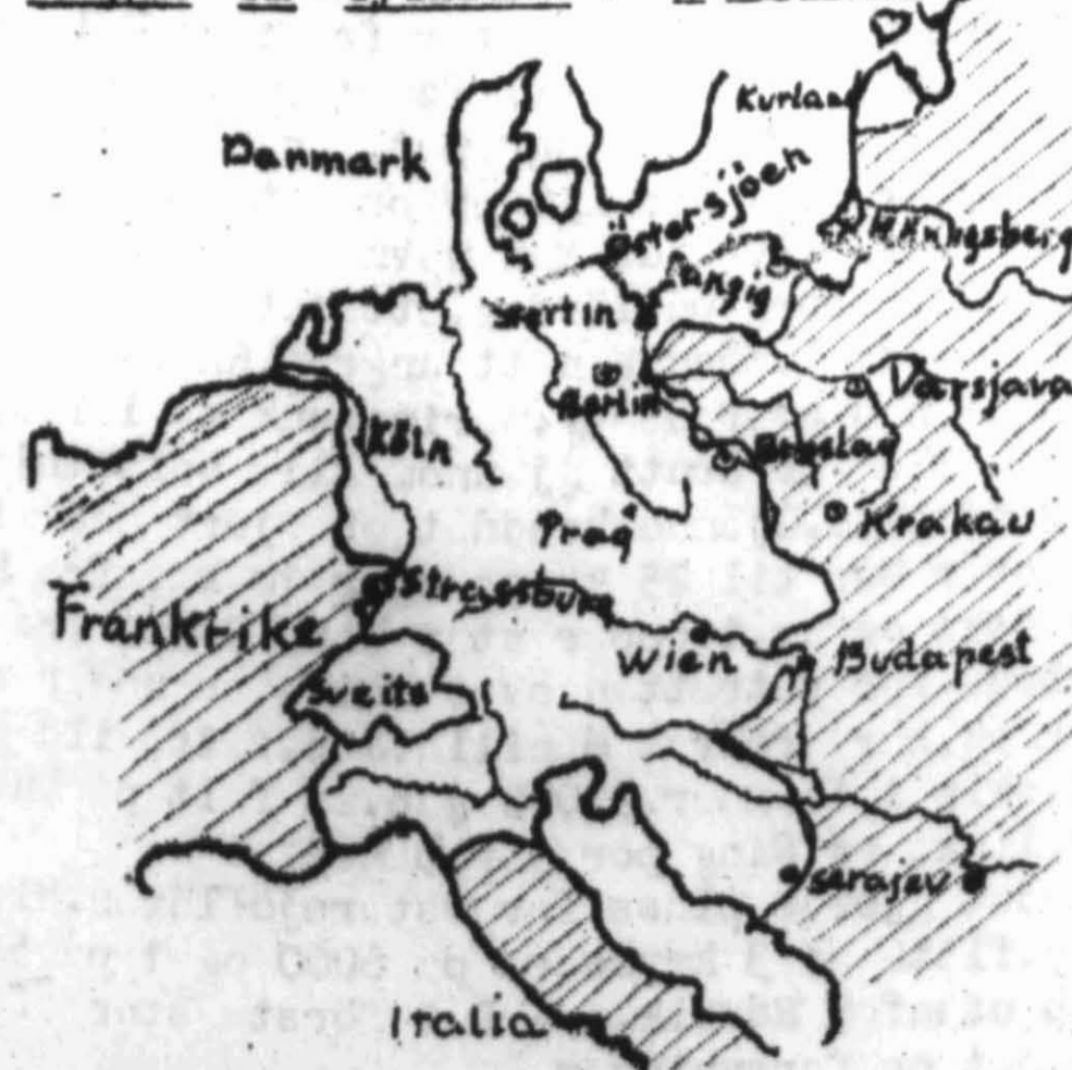
Ringene om Tyskland. 3. februar.

På vestfronten ser været ut til fremdeles å være til hinder for full fart i angrepet. Der er svære snemengder og sterk kulde veksler med tøvær. Imidlertid synes storangrep å være satt inn på 1. armé's front syd for Mondschaue og amerikanerne kjemper på sine steder langt inne (6 km.) i Westvollens anlegg. I Elsass trykkes tyskerne langsomt men sikkert ut. Av de 35000 tyskere i Kolmar-lommen er 2/3 tilintetgjort eller tatt til fange.