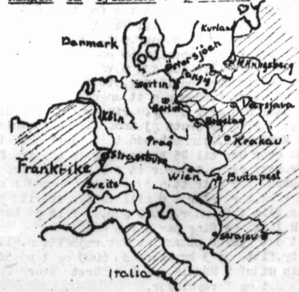
Ringene om Tyskland. 3. februar.

På vestfronten ser været ut til fremdeles å være til hinder for full fart i angrepet. Der er svære snemengder og sterk kulde veksler med tøvær. Imidlertid synes storangrep å være satt inn på 1. arme's front syd for Mondschau og amerikanerne kjemper på sine steder langt inne (6 km.) i Westvollens anlegg. I Elsass trykkes tyskerne langsomt men sikkert ut. Av de 35000 tyskere i Kolmar-lommen er 2/3 tilintetgjort eller tatt til fange.