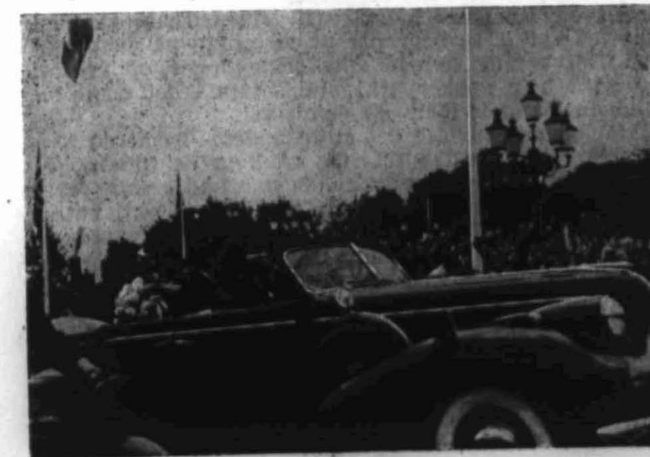
7. juni: Kongen og kronprinsesse Märtha på veg til slottet.

grunn har han fortsatt sin ferd, rakt og ubøyelig. Derfor kunde også konge og regjering være sterkere enn noensinne, selv om den overmektige fiende oversvømmet landet, og selv om dagene ble tyngre. Det var en mørk dag i flere henseender den gang Konge og regjering skulde treffe valget om de skulde gi opp eller fortsette den tilsynelatende så håpløse og ulike kamp. Valget var ikke lett, men de valgte rett: Kam-