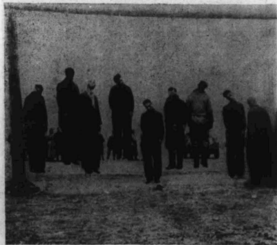
Ved de tyske konsentrasjonsleirene var hengning en daglig foreteelse. Dette er fra Tunnefors-leiren.

«Men sadisme har jeg sett nok av, og det er skrevet mer enn nok om det,» uttalte lektor Stinessen til slutt. «Det bringer neppe noen positive resultater. Den slags må selvsagt utrykkes, men det oppnår man ikke med hat. La oss framfor alt renske våre hjerter for hat. Hvis vi ikke makter det, da har nazismen seiret i våre hjerter. Jeg for min del vil ikke gå mindre ut av fengslet, men større. Det er mange av oss fanger fra de tyske