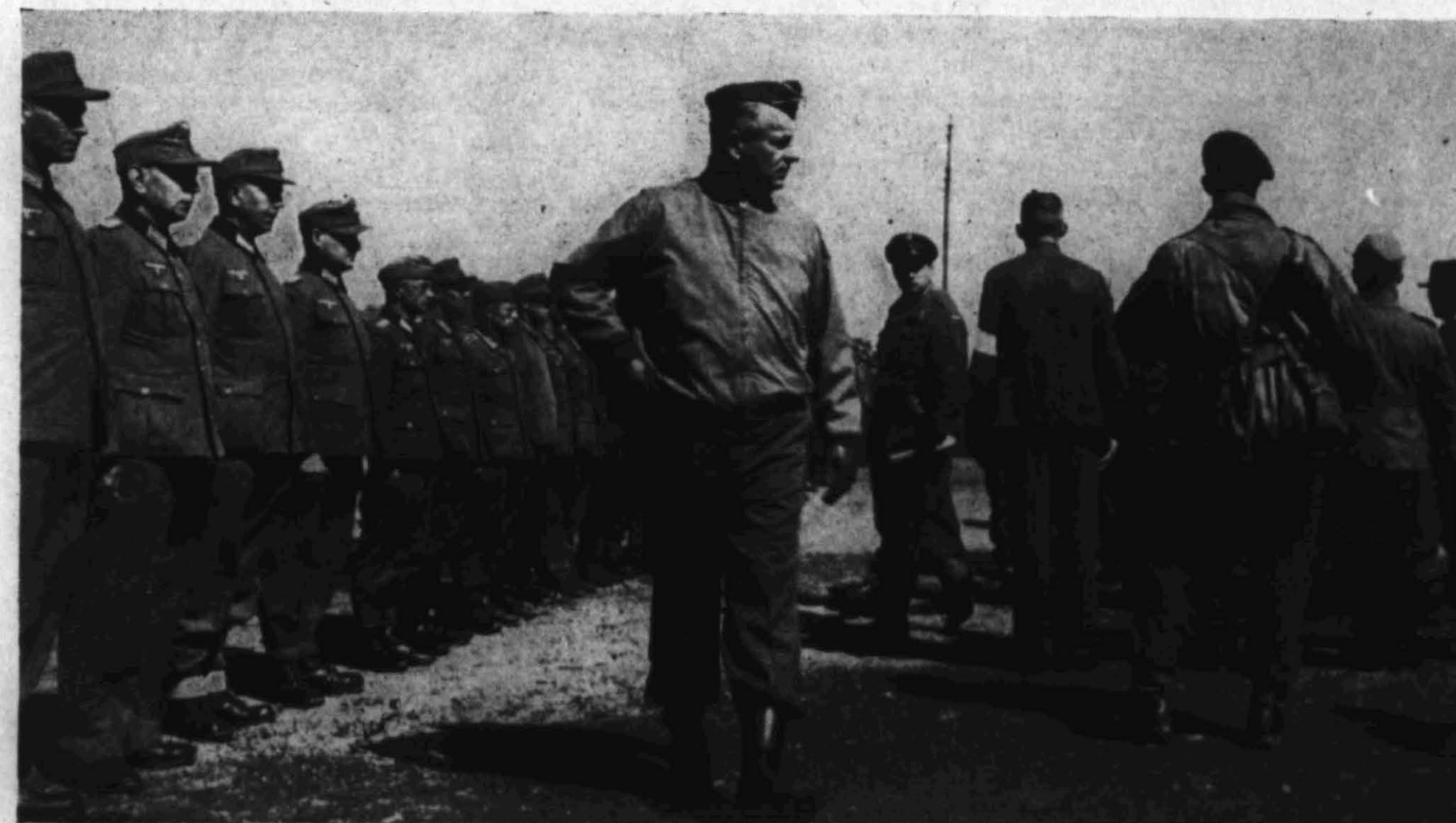
Flere geledd av arresterte gestapister fra Østlandet inspiseres av den amerikanske øverstkommanderende i Norge, general Summers.