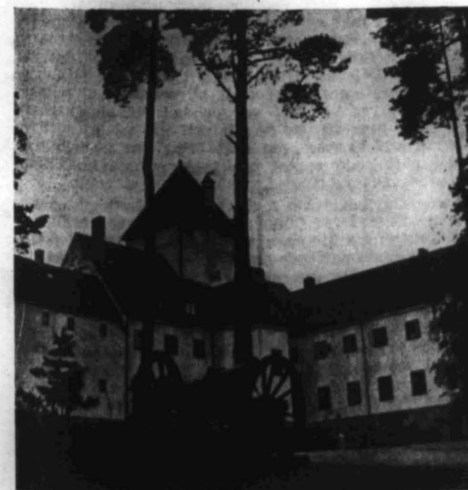
Quislings «slotta» på Bygdøy: Gimle. Han innrettet seg her i overdådig luksus.

Hjemmefronten er ikke noe politisk parti. Den er upolitisk. Der finnes innen våre rekke menn fra det ytterste høyre til ytterste venstre. Målet har vært: Et fritt Norge, — et Norge som så snart som mulig skal være rensset for tyskere og andre parasiter. Vårt arbeid er snart ferdig, men vi vil gjerne at den erfaring som hjemmefronten sitter inne med ikke skal forsvinne, men komme vårt land til gode. Det skjer ikke ved å ombytte menn i ledende stillinger innen administrasjonen, den sivile som den militære, med folk som har vært regjeringens tro tjenere i utlandet. For vel har utsynet for disse vært videre enn for den hjemlige mann, men erfaringene har vi gjort her hjemme og når alt kommer til alt er kanskje det den sikreste grunn å bygge på. Og så: Velkommen hjem til samarbeid til våres alles felles beste.