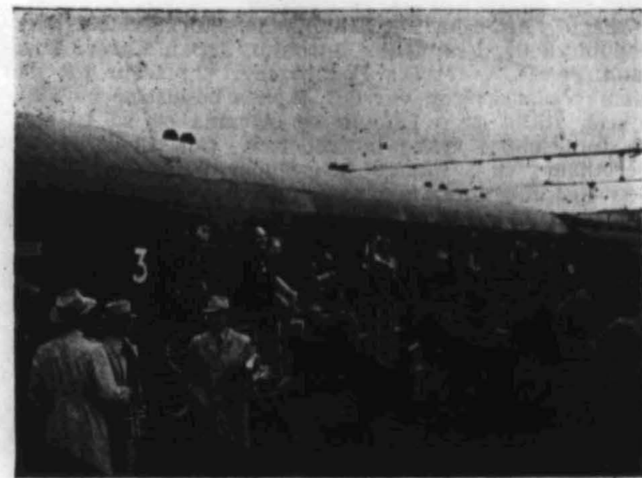
Norske politifolk kommer fra konsentrasjonsleiren i Tyskland via Sverige.

For en utenforstående synes det som om dette vil bli en urettferdig og hård dom. Man må jo huske på at de aller fleste av politifolkene som gikk inn i NS ikke gjorde dette fordi de var nazi-