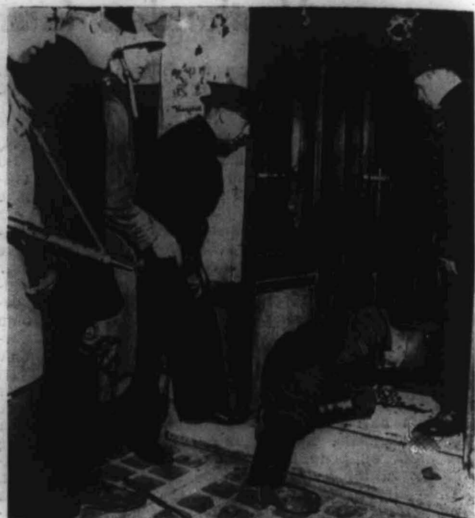
7. mai. En tysker gikk berserkergang og ble skutt. Et av de få intermezzoer like etter kapitulasjonen

fengslene som føler det slik. Kanskje nettopp mest blant dem som var hardeste oppe i det.