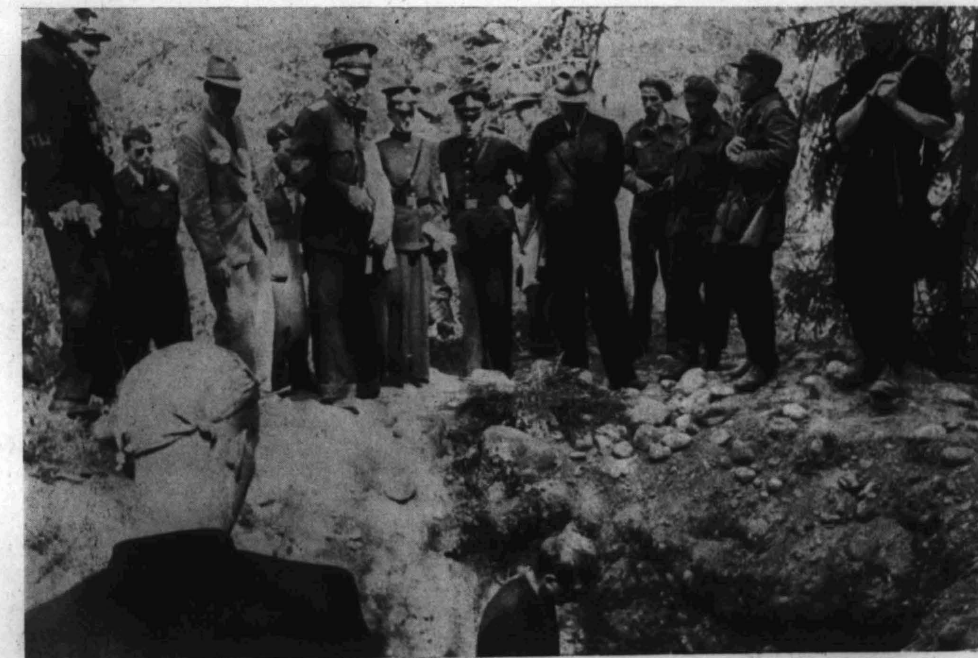
Quisling (mellom politiet og hjemmestyrkene) står her ved en av gravene på Trandum.

Da sentralfronten var stabilisert ble Sjukov flyttet over til Stalingrad som ble truet av von Paulus og von