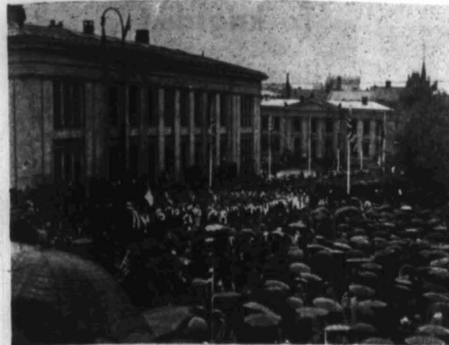
17. mai i Oslo: Meget regn, men høy stemning.

22. november holdt kong Albert sitt inntog i Brussel, og samme dag ble det dannet en ny regjering med Delacroix som sjef. Både Broqueville og Cooreman var med i regjeringen som var en virkelig koallitionsregjering. Alle de tre store partiene var representert noenlunde etter sin representasjon i kamret: 6 klerikale,