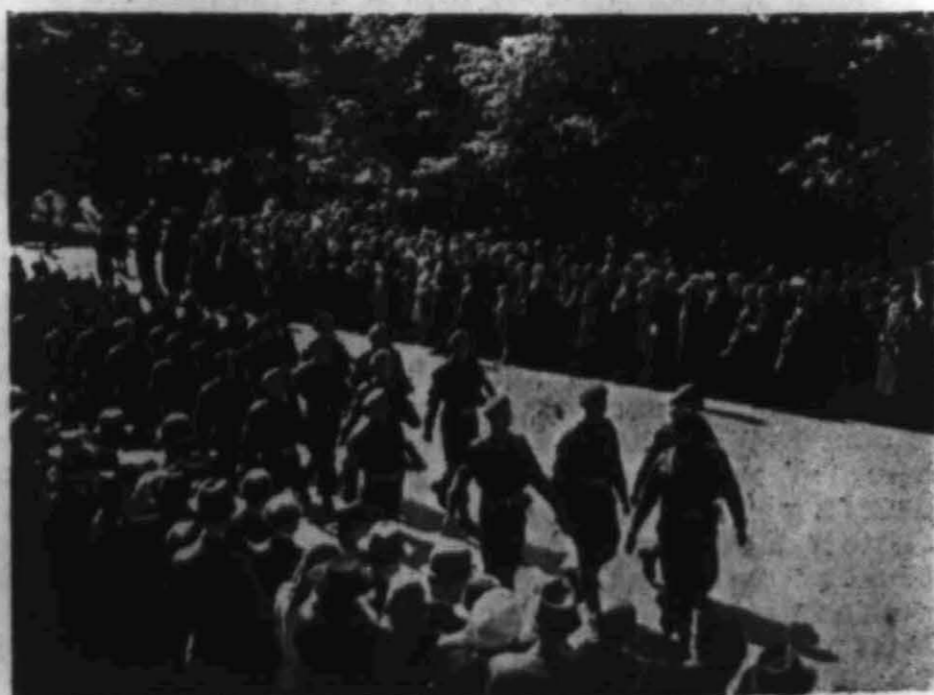
Allierte tropper paraderer i Oslo.

Vi hylder og takker danskene for den holdning de har vist og for de håndgripelige utslag de har latt sin samfølelse med Norge få. Mange og sterke bånd er blitt knyttet mellom våre land i disse tunge årene; måtte de bare holde og bli enda sterkere og tallrikere. Dette er praktisk skandinavisme. Nå står det til oss å vise at vi har vært verdige til all denne hjelp og samfølelse. La oss ikke glemme det!