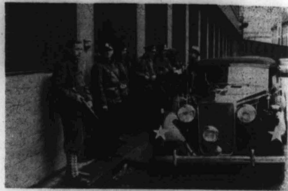
Hjemmestyrker har overtatt Storgt. 33 hvor den tyske Oslo-kommandant hadde sitt kvarter.