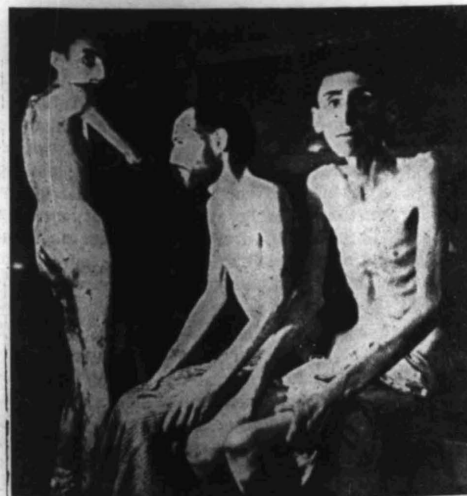
I denne forfatning fant man fangene i den beryktede Buchenwald konsentrasjonsleir.

Det er en ung student fra Høyskolen i Trondheim som forteller oss dette og meget annet. Han er nettopp kommet lykkelig tilbake fra et 16 måneders opphold i Sachsenhausen, eller Oranienburg som vi her hjemme har pleid å kalle leiren. Han understreker at hans historie på ingen måte er noe enestående, og at det han kan fortelle bare er en solstrålefortelling mot det andre kan berette fra den harde tiden i Sachsenhausen før Stalingrads fall eller fra andre leire. Før