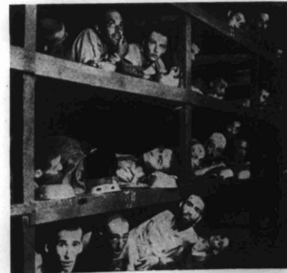
Syke fanger i Buchenwald konsentrasjonsleir.

17. mai i fjor ble han overflyttet til Luckau, en by