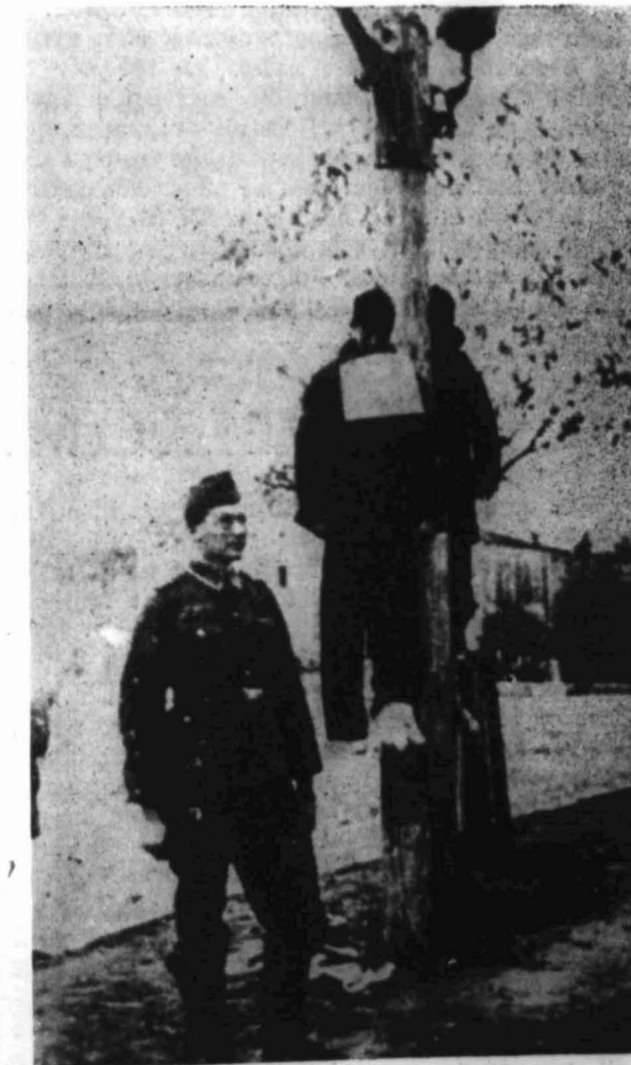
Henrettelse av fanger i Tunnefors konsentrasjonsleir i Tyskland.

Stalingrads fall var nemlig Sachsenhausen en regulær «Vernichtungslager» som kostet mange fanger livet. I krigens første år skal det ha blitt drept 30 000 russere der, forteller fanger som har vært i leiren hele tiden. I andre leire levet den tyske «kultur» videre helt til det siste. Vi behøver bare nevne navn som Buchenwald, Dachau, Bergen-Belsen, Natzweiler osv. I den sistnevnte leiren døde flere studenter fra Høyskolen i Trondheim. Vår hjemmelsmann opplyser at den skilddring han kan gi bare er det daglige liv i en av Tysklands «beste» konsentrasjonsleire. — Jeg fikk beskjed om å dra til Sverige, forteller han. Ved et uhell ble jeg arrestert i Kongsvinger. Derfra gikk turen først til Akebergveien, så til nr. 19, etter en måned der en (Forts. s. 3.)