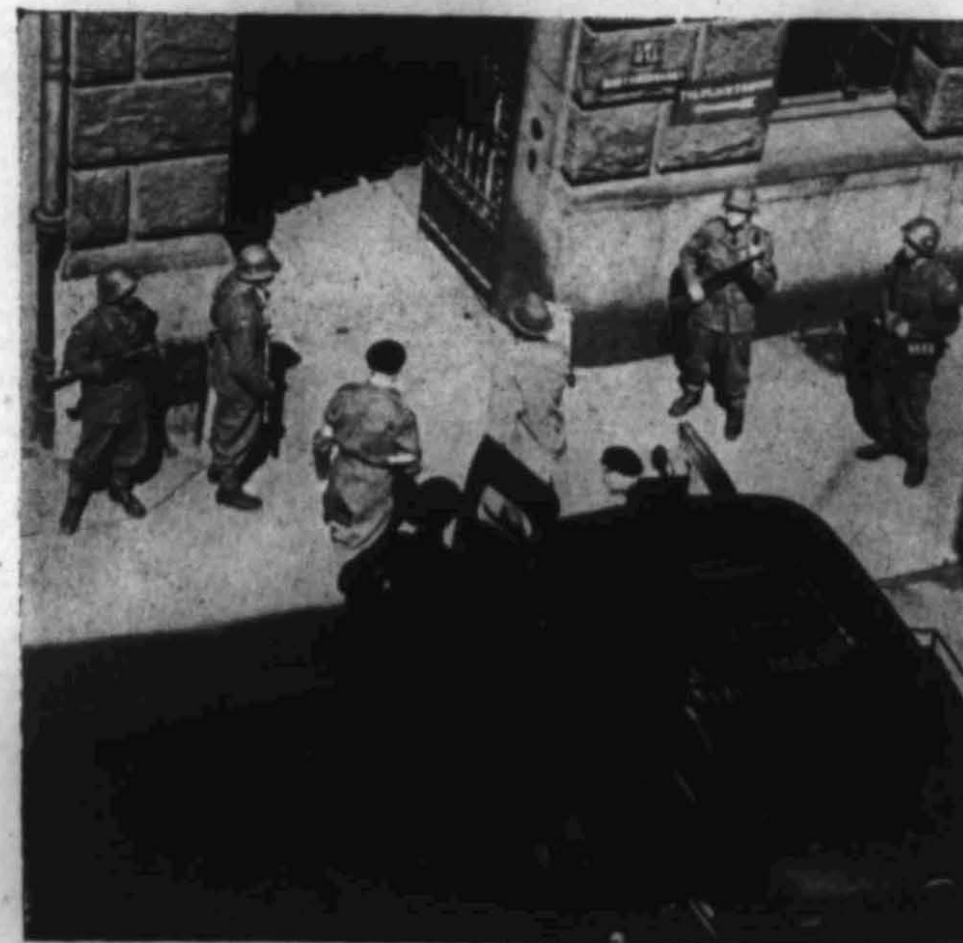
Quisling kommer til forhör.

Styrkenes leder, minister Frode Jacobsen, uttalte nylig at han vilde søke å få hjemmestyrkene overført til et hjemmevern. Dette forutsetter dog en ny — eller en forandring av den bestående lov vedrørende forsvaret. En kan gå ut fra at dette blir ordnet i sommer. Som i Norge har de danske hjemmestyrker hverken militære eller politiske ambisjoner. Styrkene er satt sammen fra alle befolkningslag og fra alle politiske partier. Det meldes for øvrig at man er i ferd med å organisere et forbund av «frihetskjemperne» på sivil basis.