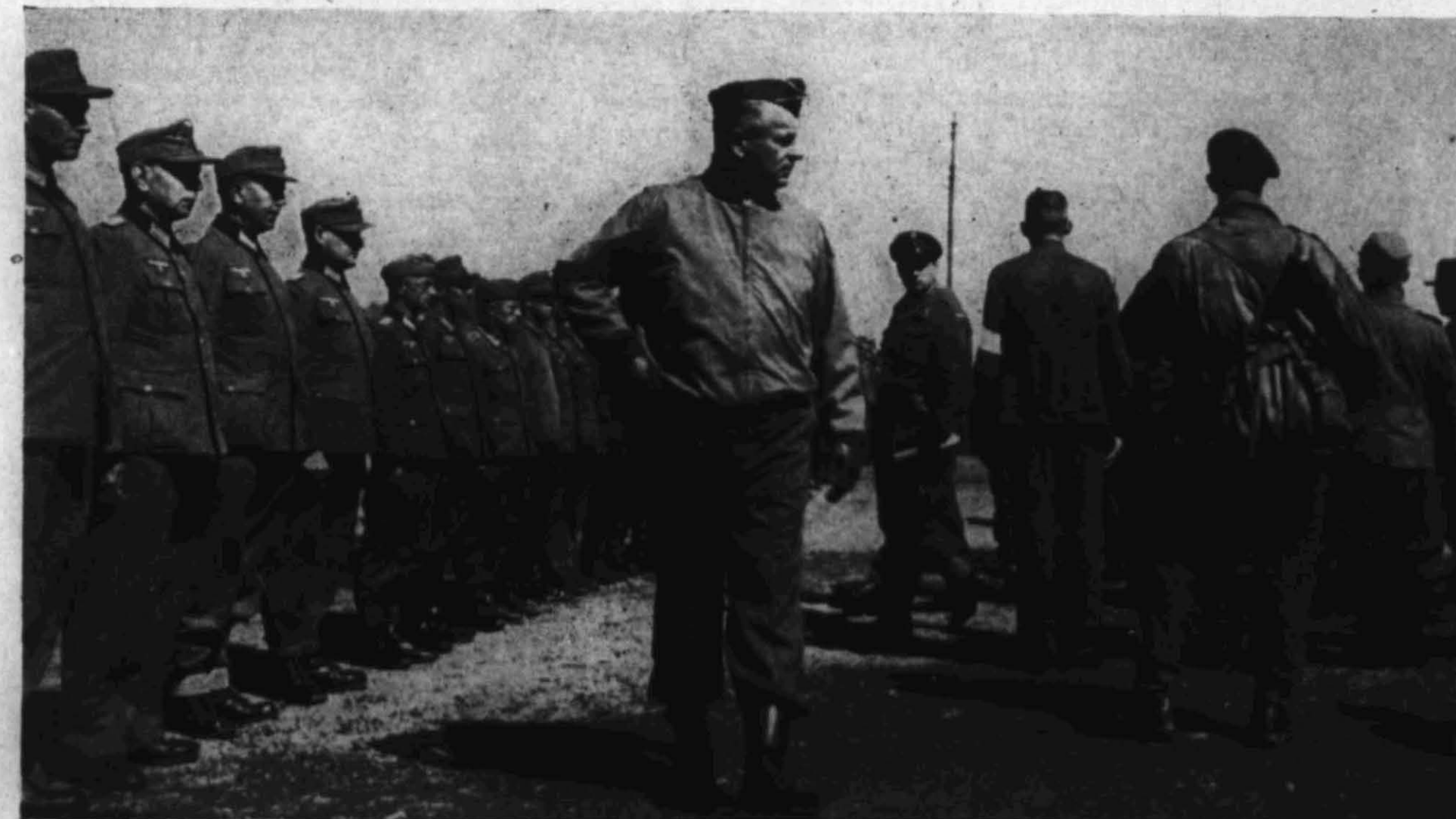
Flere geledd av arresterte gestapister fra Østlandet inspiseres av den amerikanske øverstkommanderende i Norge, general Summers.