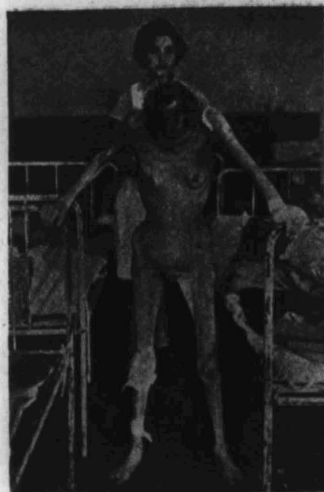
til tyskerne satte henne i konsentrasjonsleiren Belsen.

Mansteins arméer. Det historiske slaget om Stalingrad varte i 21 uker og oversteg i voldsomhet alle tidligere trefninger under krigen. Det som så ut til å bli en katastrofe for russerne forvandlet seg under Sjukovs ledelse til en seier som man vel kommer til å regne blant historiens vendepunkt.