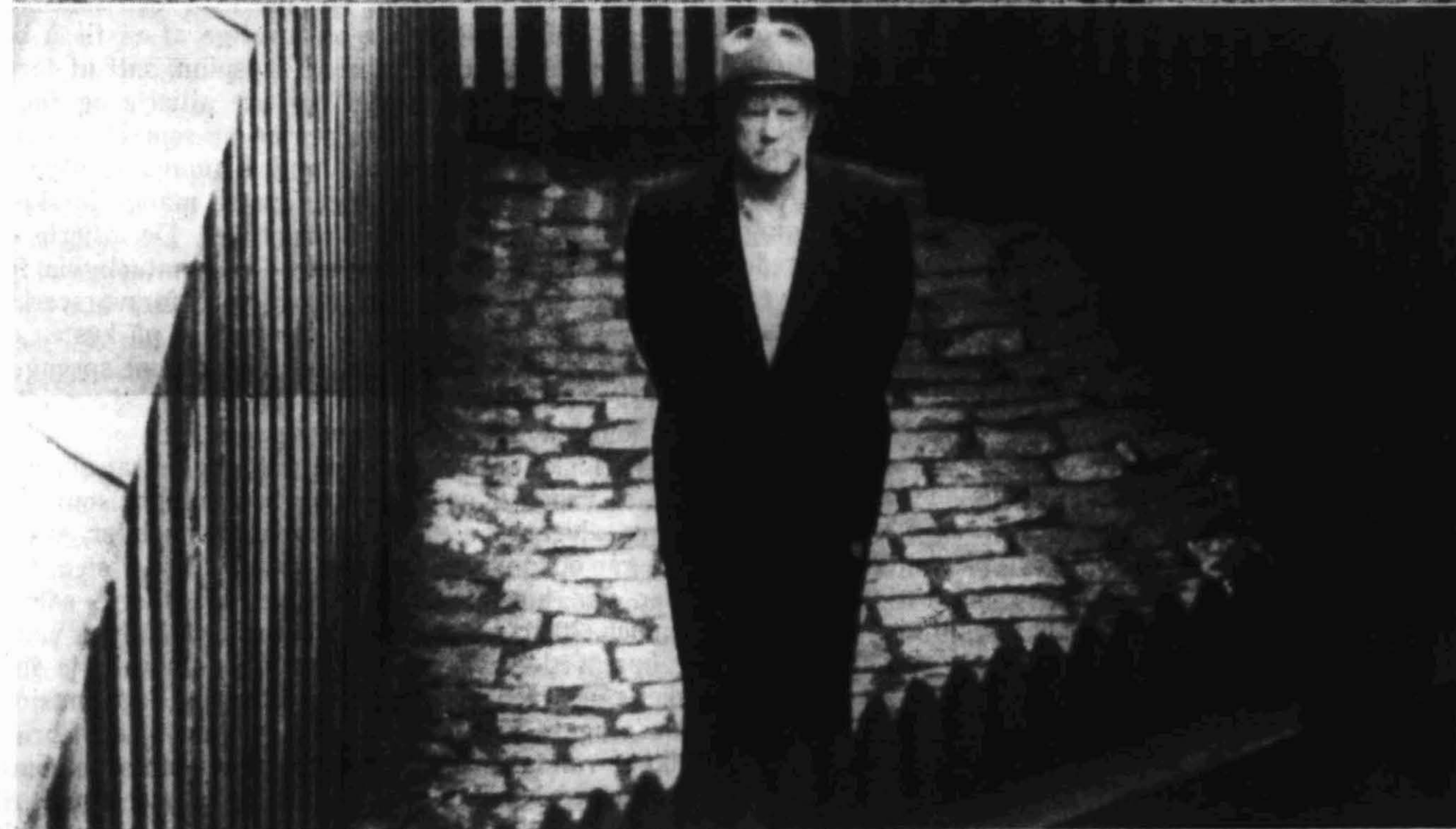
Quislings knall og fall. — Øverst ser en Quisling tale det norske folk «midt imot» utenfor slottet. Nederst et bilde fra den tiden han satt og ventet på folkets dom (tatt fra en herværende avis).